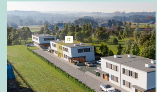
Widok osiedla z lotu ptaka