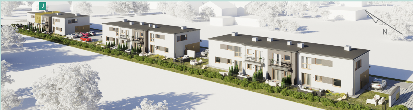
Widok osiedla z lotu ptaka

Energooszczędne, ekologiczne budownictwo