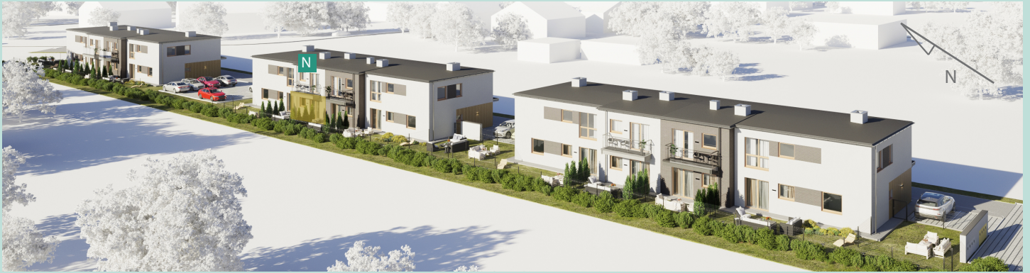
Widok osiedla z lotu ptaka

Energooszczędne, ekologiczne budownictwo