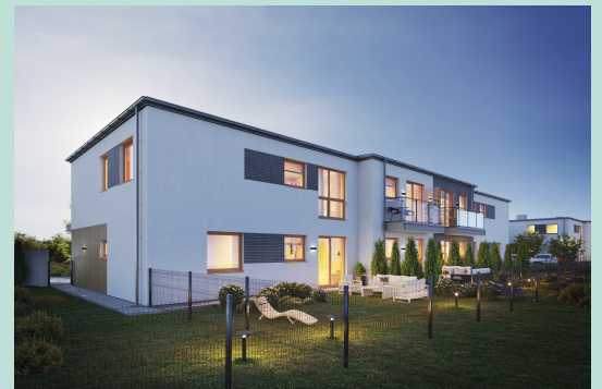
Widok budynku od strony ogródka