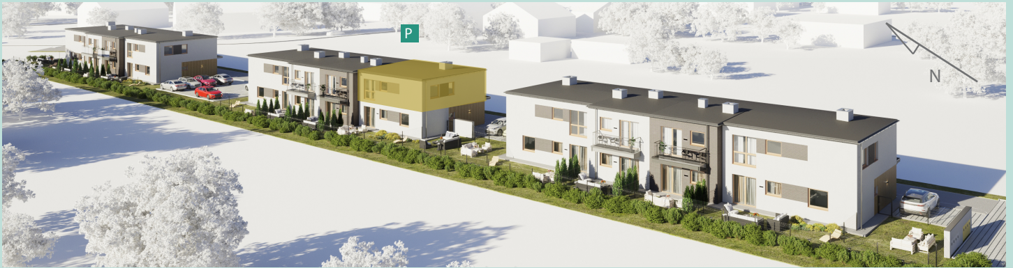
Widok osiedla z lotu ptaka

Energooszczędne, ekologiczne budownictwo